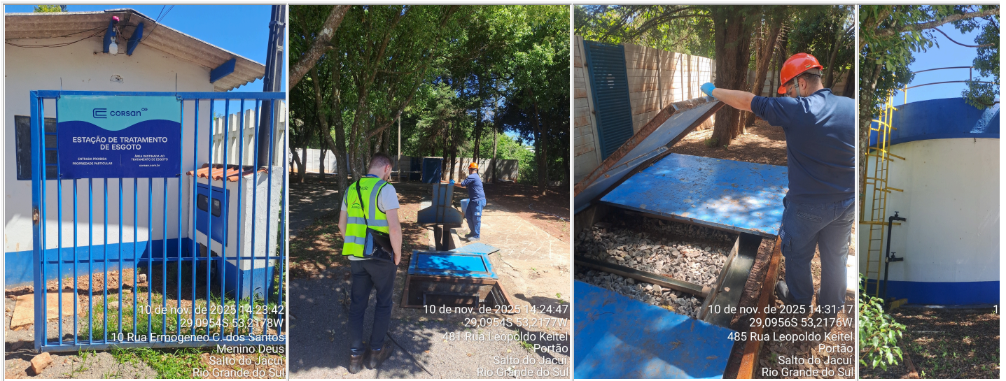
Figura 2 - Instalações da ETE Salto do Jacuí