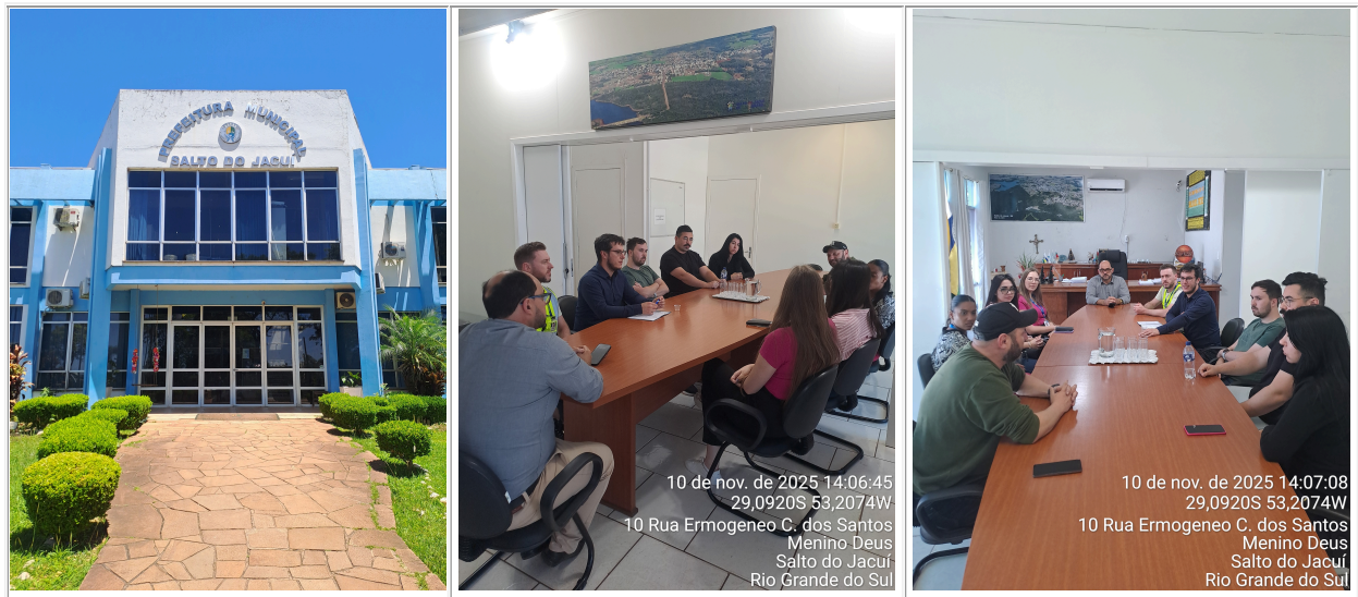
Figura 1 - Reunião de Abertura da Fiscalização - Gabinete do Prefeito.