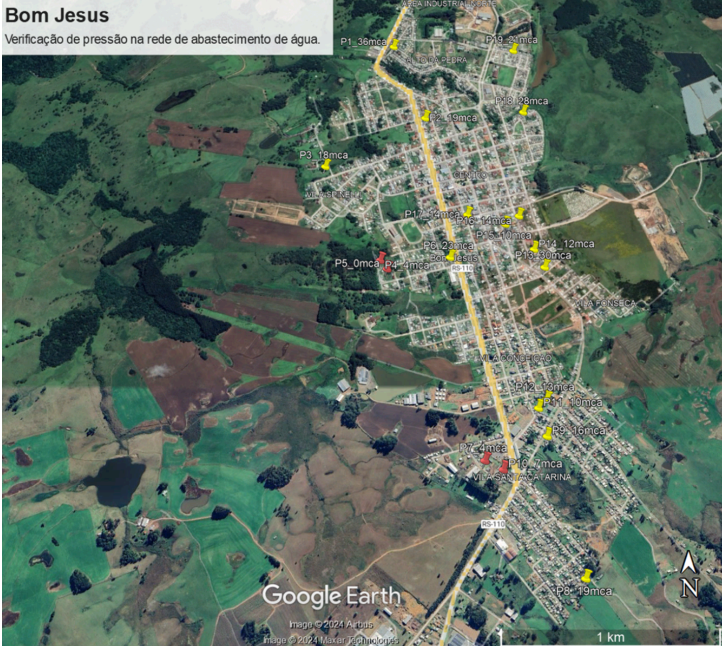
Figura 1 - Mapa com a distribuição dos pontos monitorados