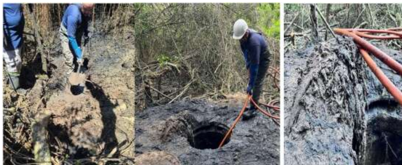
Figura 1 - Ações de desobstrução da rede de esgotamento.

A Companhia apresentou as ações de desobstrução nas redes comprovadas através de registros fotográficos da remoção de resíduos (Figuras 1 e 2). Informou ter sido removido cerca de 2,5 toneladas de material inerte do interior da tubulação, como pneus, colchões, areia, gordura entre outros, caracterizando o lançamento indevido destes materiais na rede como a principal causa da obstrução do sistema, associada à elevada precipitação pluviométrica.