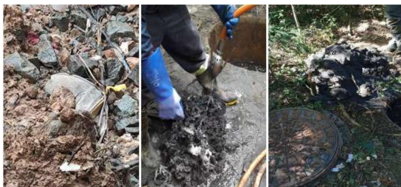
Figura 2 - Resíduos removidos da rede de esgotamento.