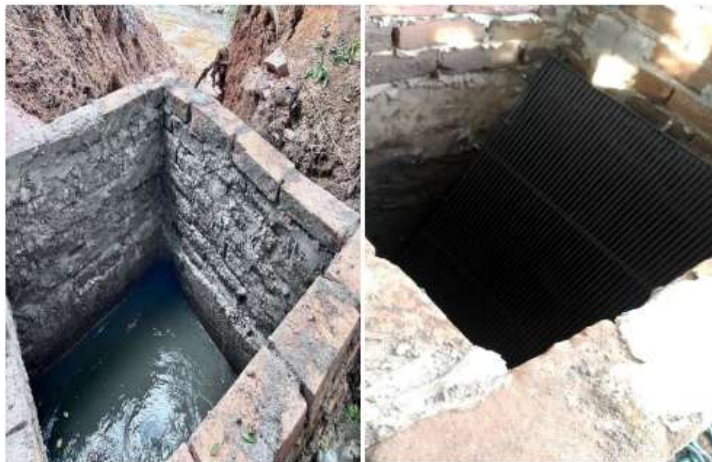
Figura 5 - Caixa de passagem com gradeamento.

Como medida preventiva, informou ter realizado a limpeza em toda a extensão da rede e executado melhorias no sistema, além de vistorias e testes de fumacê que identificaram diversos pontos de ligação pluvial irregular ao longo do emissário nas Ruas Telmo Silveira Dorneles e João Francisco da Silva.