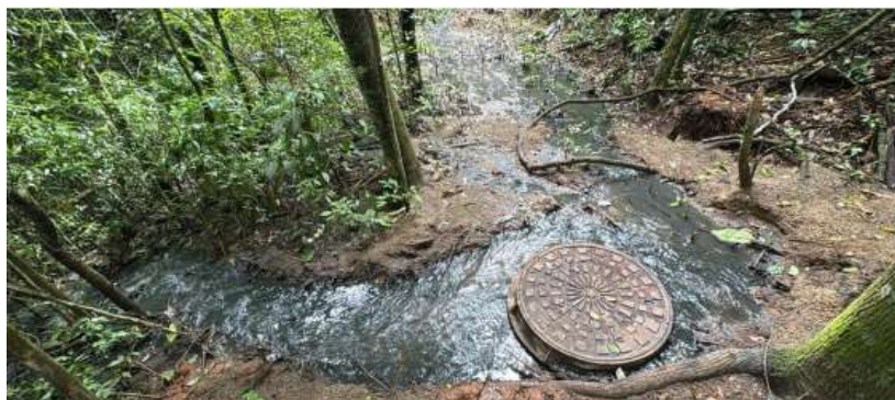
Figura 4 - Extravasamento de esgoto em PV.