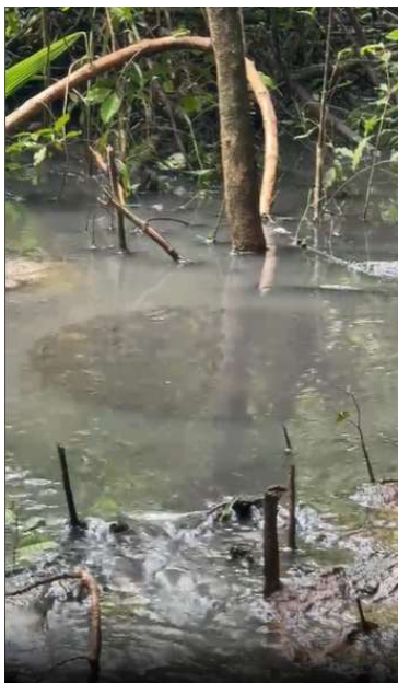
Figura 3 - Área alagada por extravasamento de esgoto em PV.

Embora a Concessionária tenha apresentado as justificativas e as ações realizadas, estas não foram suficientes para estabelecer o retorno às condições normais de operação do sistema. Conforme novas denúncias apresentadas nos documentos SEI 0542654, 0542655 e 0542656 anexados no processo 002354-39.00/25-7 são evidentes a persistência do extravasamento ao longo da rede (Figuras 3 e 4).